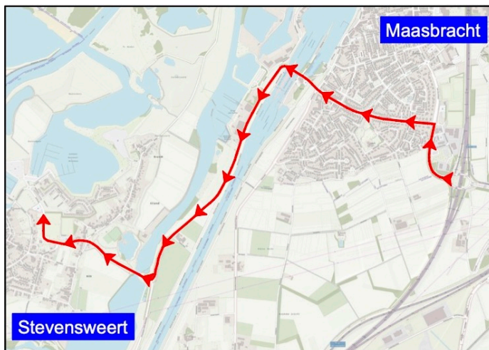
Situatieschets van de nieuwe A2-S.

De doorstroom aldaar wordt gegarandeerd door de aanleg van parkeerhavens met voorrangregelingen, aldus een van de wethouders. De brug over de Oude Maas